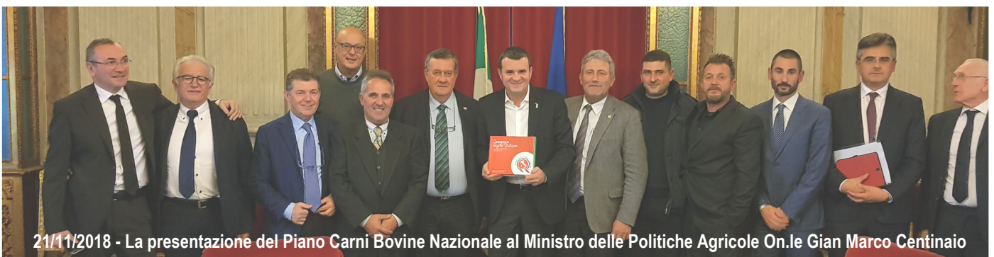
21/11/2018 - La presentazione del Piano Carni Bovine Nazionale al Ministro delle Politiche Agricole On.le Gian Marco Centinaio

Per chiudere in bellezza l' Anniversario di Unicarve , il taglio della "Torta dei Traguardi" .